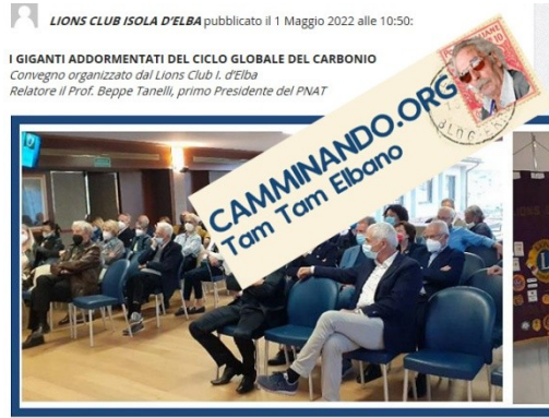
"Tutti i giorni dovrebbero essere la Giornata Mondiale della Terra", è un aforisma pronunciato